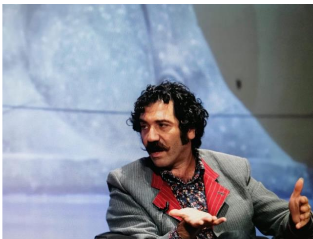
Michael Rakowitz.