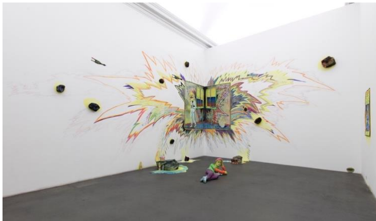
Giuliana Rosso, Finchè quel che fantastichiamo è stato , 2020

Finchè quel che fantastichiamo è stato , 2020, è un'installazione ambientale commissionata a Giuliana Rosso in occasione della mostra Espressioni . La proposizione è recentemente entrata a far parte delle Collezioni del Castello quale comodato dalla Fondazione per l'Arte Moderna e Contemporanea CRT.